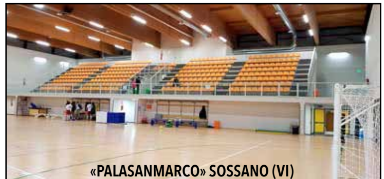
«PALASANMARCO» SOSSANO (VI)